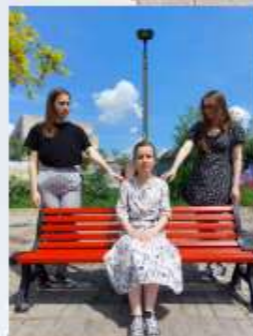
Death is inevitable but memories about loved ones live in us

During the Erasmus+ Project, we had an opportunity to see how palliative care look like. No we see that theory is theory but in practical use it requires many skills to be good at. We saw patients: in various mental and physical conditions - it showed us wide variety of cases that carer should be prepared for. Some visits were cheerful, some - really moving and emotional. We feel great respect to all carers and their work and appreciation to imput, the imput of paliative care in aim to make people life better at their final stage. :-)