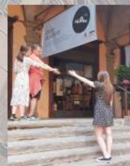
It is hard to say goodbye to people you loved and passed away