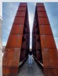
Standing in between life and death

Erasmus+ Project Death Education for Palliative Psychology - DE4PP