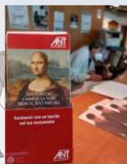
There is a hope in palliative care