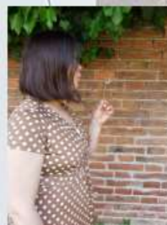
Life volatile as blowball of dandelion clock

Erasmus+ Project Death Education for Palliative Psychology - DE4PP